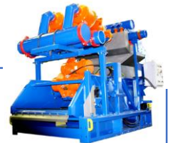
Оборудование для ТЭК