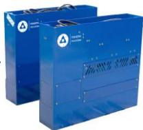
Литий-ионные накопители для транспорта